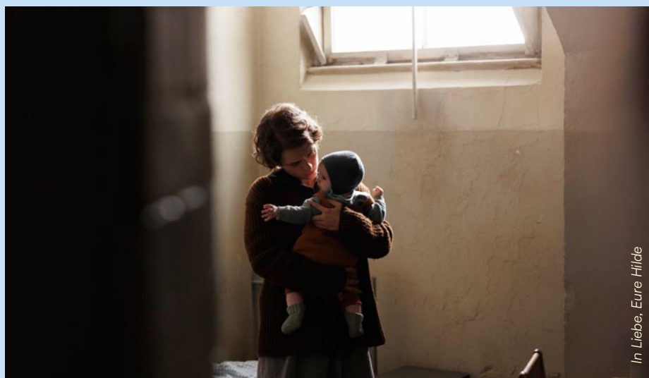
In Liebe, Eure Hide