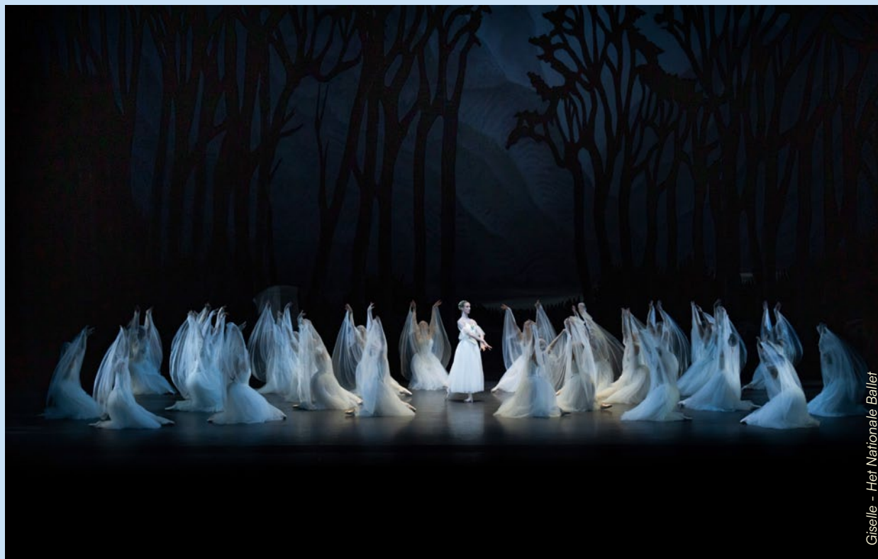
Giselle - Het Nationale Ballet