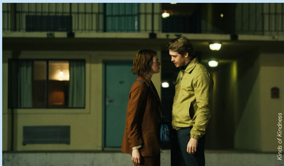
Kinds of Kindness